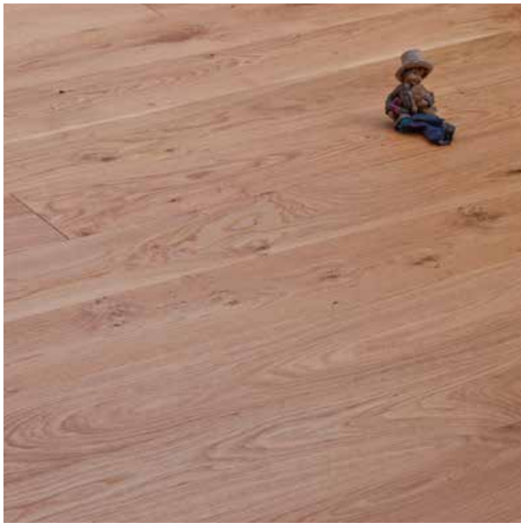
PH Naturel & Rustic