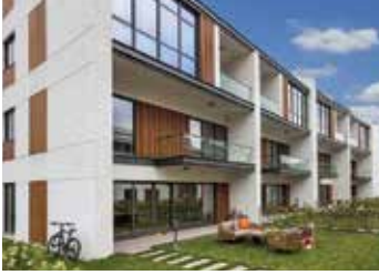
Siyahkalem Zekeriya köyü Köy Projesi

%100 memnuniyet yarattığımız müşterilerimizden bazıları.