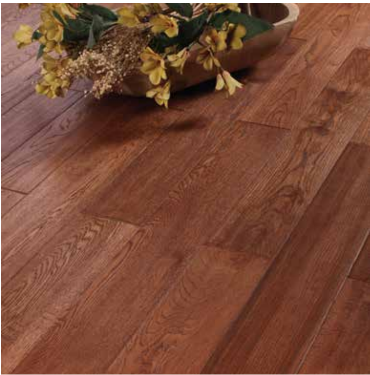
PH Natural & Select