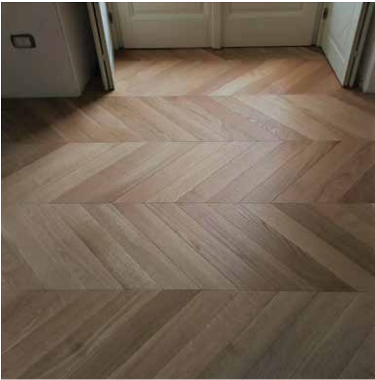
PH Macar / Chevron