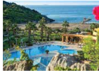
Robinson Club Sarıgerme