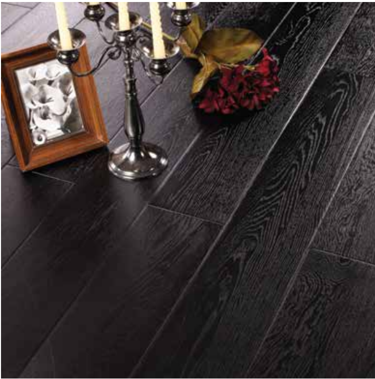
PH Testere Saw Effect