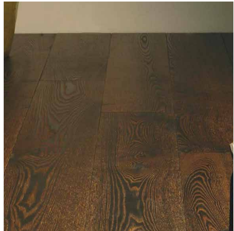
PH 50 Smoked