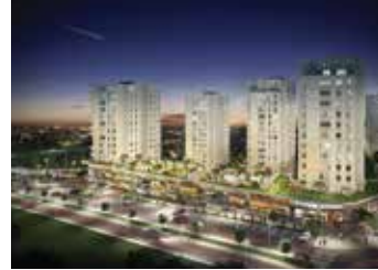
Banu Evleri Bahçeşehir