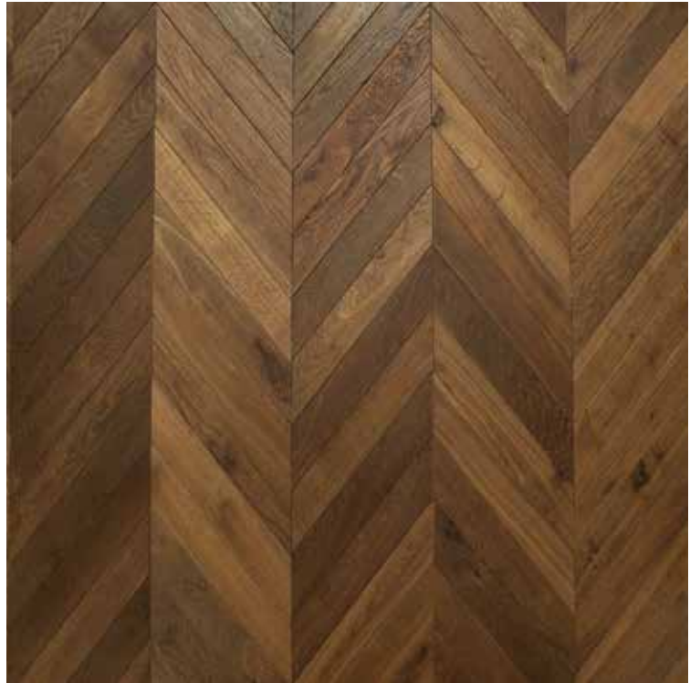
PH Balıksırtı Herringbone