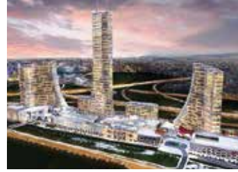
Metropol Ataşehir Ataşehir Projesi