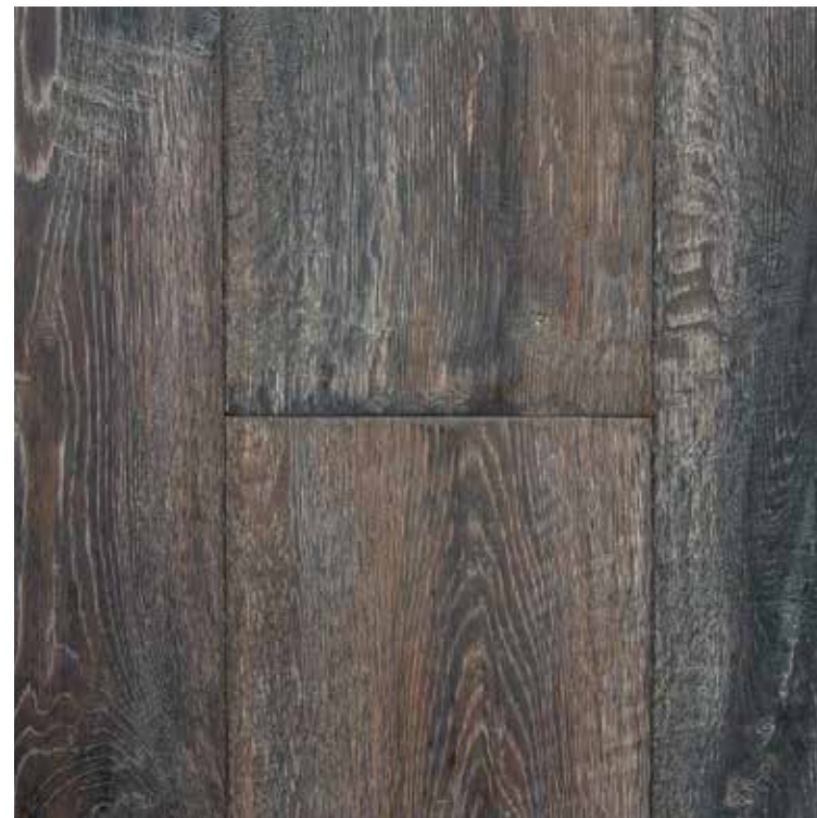
PH 35 Hand Scraped