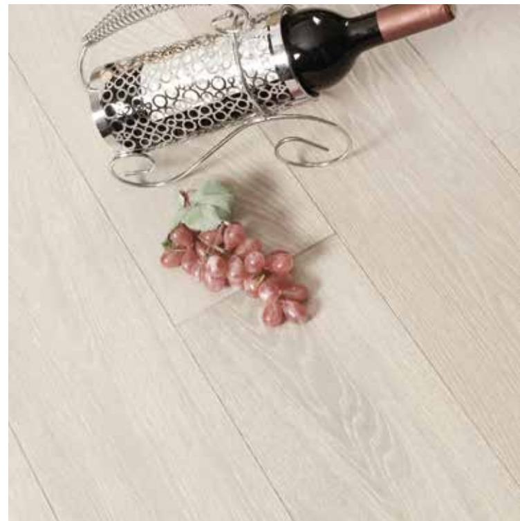
PH 30 White Wash