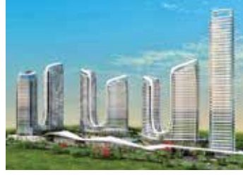
Iconova Gaziantep Gaziantep Projesi