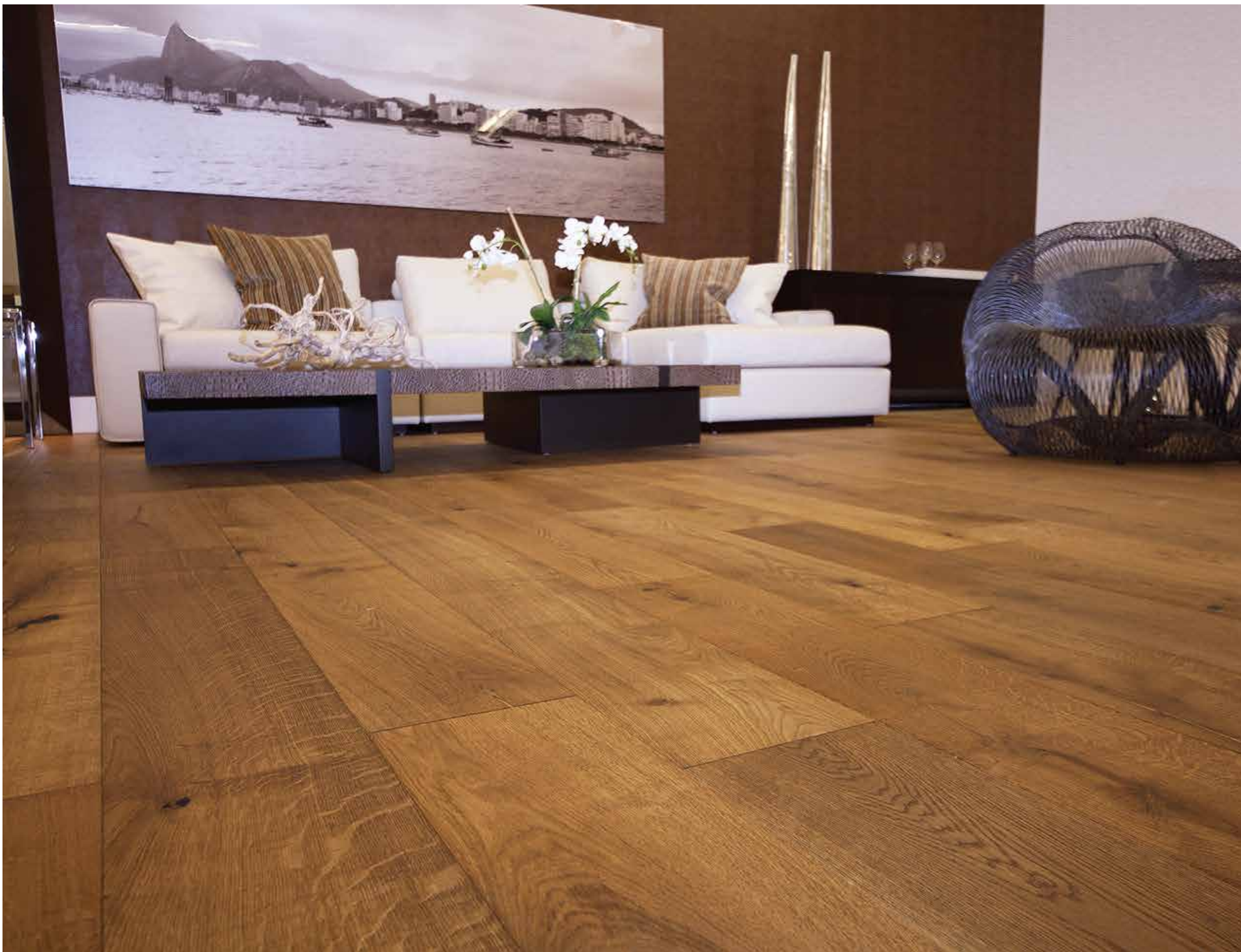
PH 24 Vintage