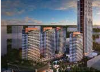
Babacan Yapı Crown Deluxe Bahçeşehir Projesi