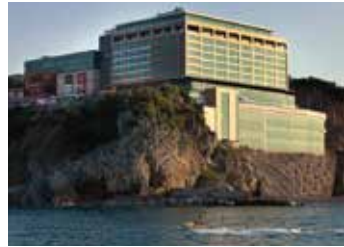
Dedeman Hotel Zonguldak